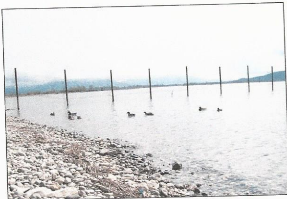
Abbildung 1: Sentinel-Anlage in der Fussacher Bucht.

Zur Ermittlung der Prävalenz von AIV in verschiedenen Vogelarten sowie ihrer jahreszeitlichen Verteilung wurde anlässlich der ordentlichen Wasservogeljagd bei erlegten Wasservögeln kombinierte Rachen- und Kloakentupferproben entnommen. Weitere Proben stammten von Wasservögeln verschiedenster Arten (vor allem Enten, Möwen und Rallen), die mit ganzjährig betriebenen Schwimmreusen in Radolfzell (Deutschland) und Kreuzlingen (Schweiz; Abb. 2) sowie mobilen Fangeinrichtungen